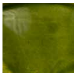
verde foglia cod. E