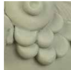
pistacchio cod. PI