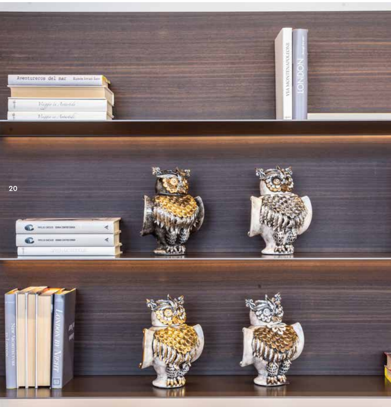
sopra da sinistra cod. CVF/LUX cod. CVF/PL cod. CVF/ORO cod. CVF/RA