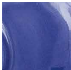
viola cod. C