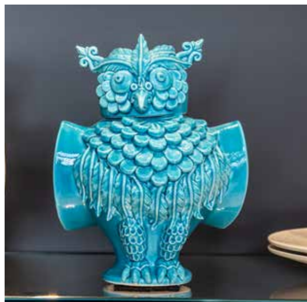
sopra cod CVF/A sotto cod. CVF/T