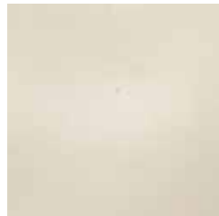
bianco opaco cod. A