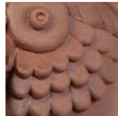
marrone cod. MA