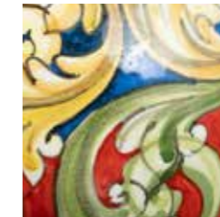
barocco cod. BA