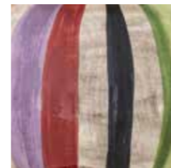
stripe red cod. ST-RED