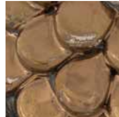
rame cod. RA