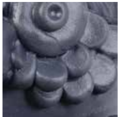
blue cod. BL