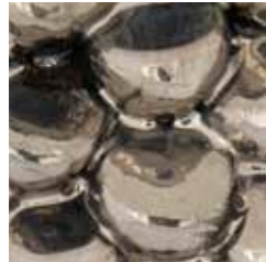
platino cod. PL