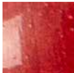
bordeaux cod. X