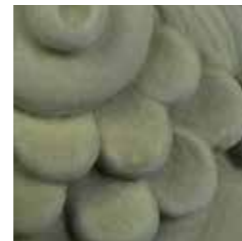
verde cod. VE