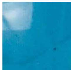
turchese cod. T