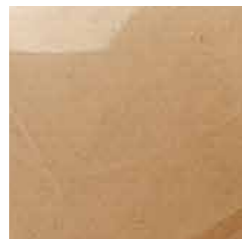
tortora cod. O