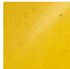
giallo cod. L