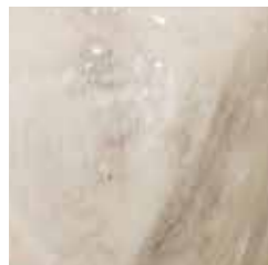
bianco antico cod. Q