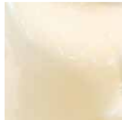
bianco lucido cod. Z