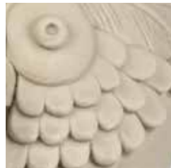
ghiaccio cod. GH