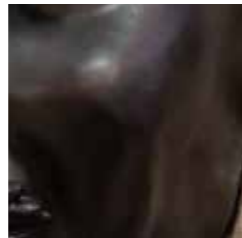
nero lucido cod. W