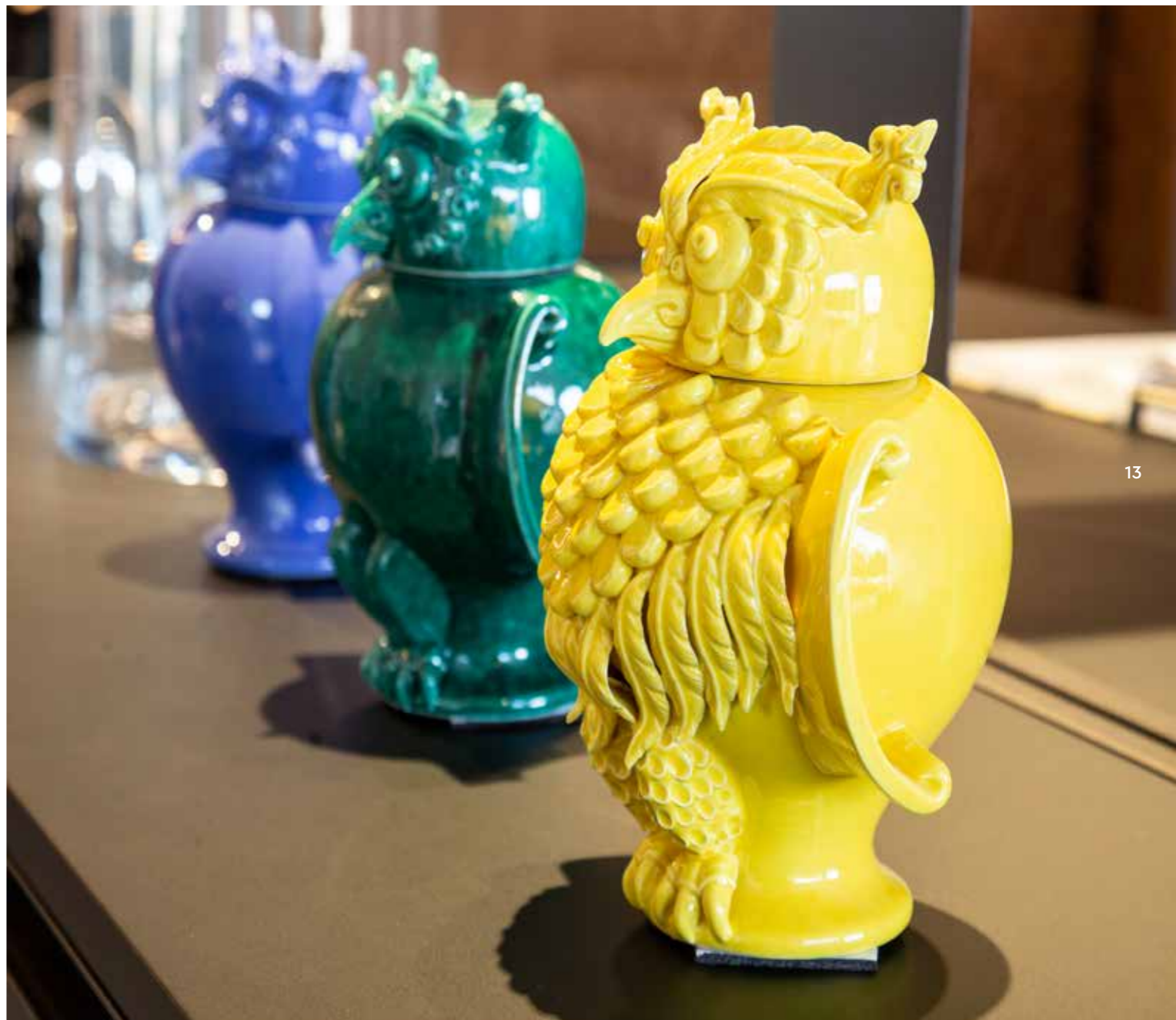
da sinistra cod. CV/C cod. CV/R cod. CVF/L