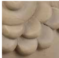
sabbia cod. SA