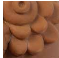
terracotta cod. TE