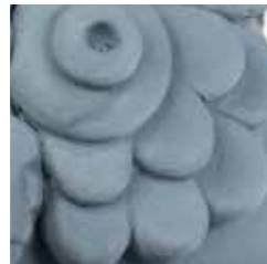
avion cod. AV