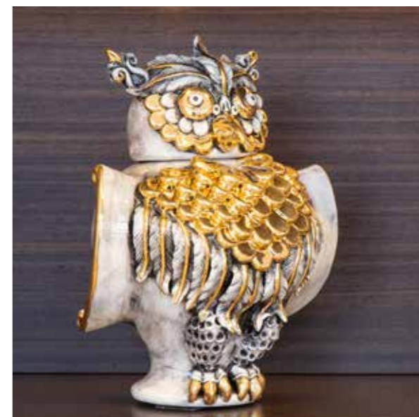
sopra cod. CVF/RA sotto cod. CVF/ORO